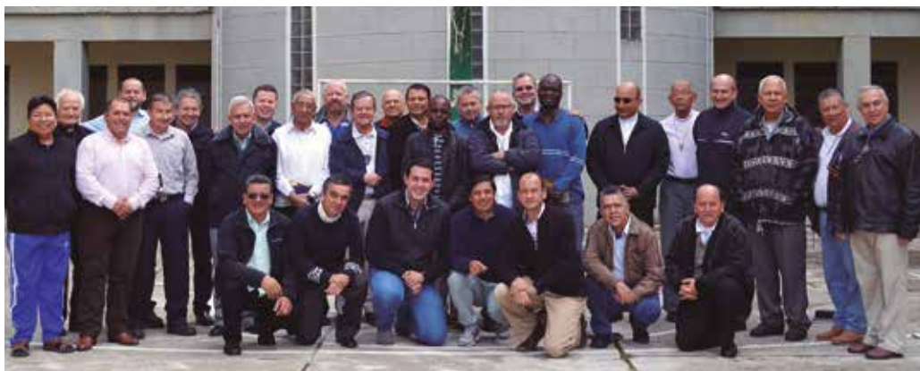
Participantes en la XIII Asamblea General del Instituto de Misiones Extranjeras de Yarumal Yarumal, 6 de noviembre al 3 de diciembre de 2018

Del 6 de noviembre al 3 de diciembre del año pasado, se realizó en Yarumal la XIII Asamblea General del Instituto de Misiones Extranjeras de Yarumal. Además de la elección del nuevo Consejo General del Instituto, la Asamblea evaluó la marcha del Instituto y se comprometió con una nueva etapa de evangelización en todos los lugares en donde hacemos presencia misionera.