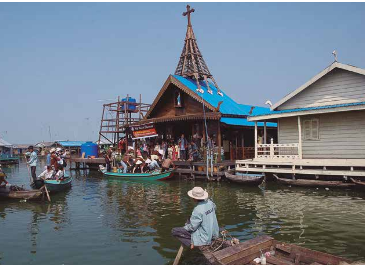
Iglesia flotante - Camboya